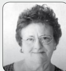
Ferrari Teresa di anni 82